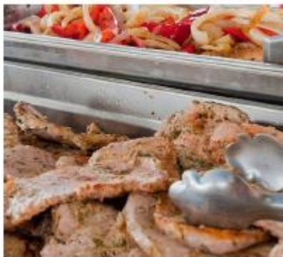
GRILL BARBACOA n°1

ENSALADAS + GRILL BBQ (SIN BEBIDAS INCLUIDAS)