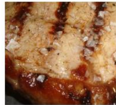
GRILL BARBACOA DELUXE

ENSALADAS + GRILL BBQ DELUXE (SIN BEBIDAS INCLUIDAS)